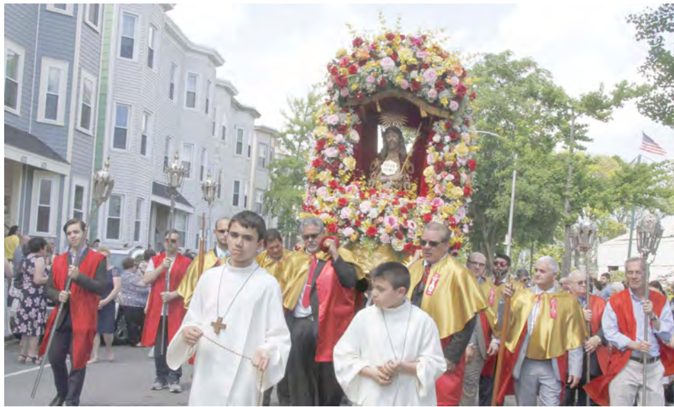
Festas do Senhor Santo Cristo dos Milagres na igreja de Santa Isabel em Cambridge, MA