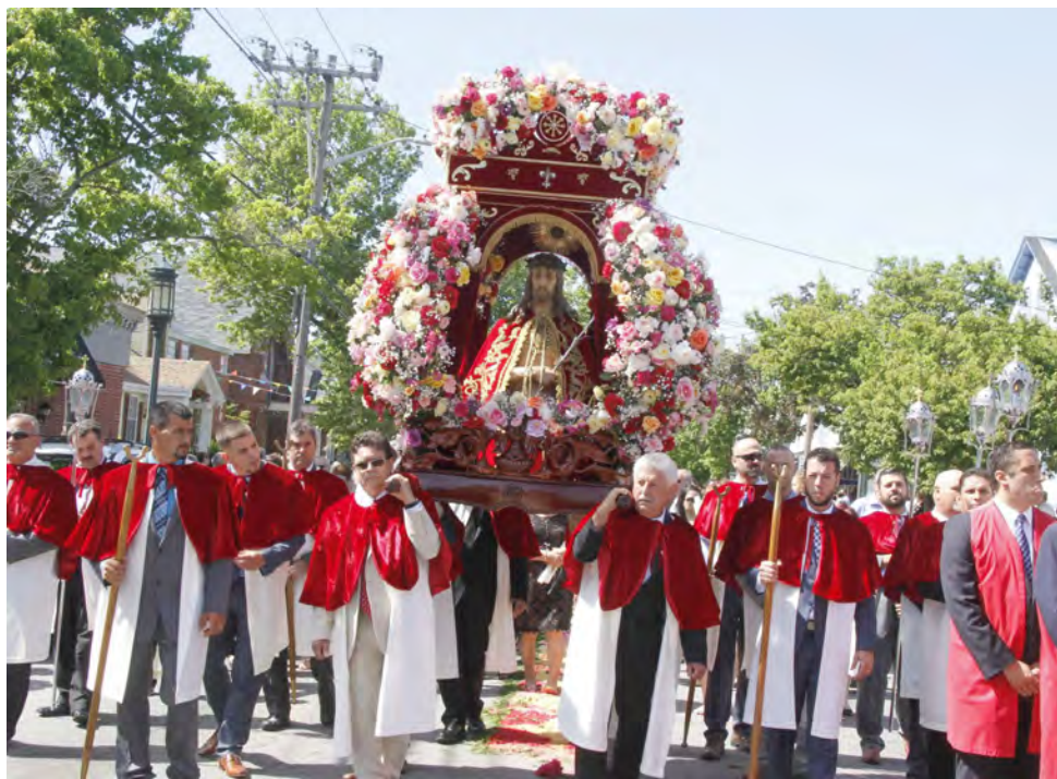
Festas do Senhor Santo Cristo dos Milagres na igreja de Santa Isabel em Bristol, RI.