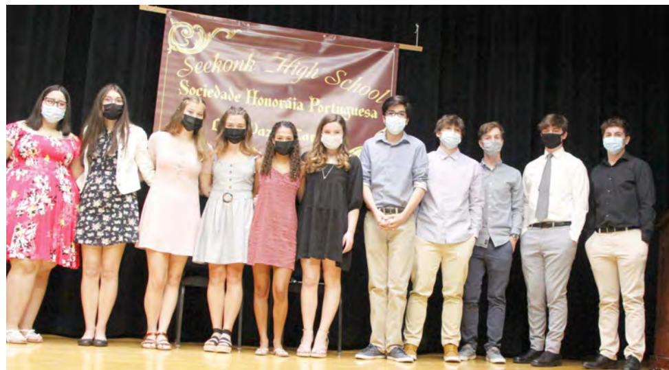
Nas fotos acima e abaixo, alunos do Seekonk High School membros da Sociedade Honorária Portuguesa Luís Vaz de Camões, do quadro de honra.