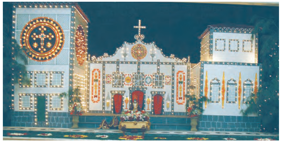
Na foto acima, uma réplica do Santuário do Senhor Santo Cristo na Sociedade Cultural Açoriana em Fall River.