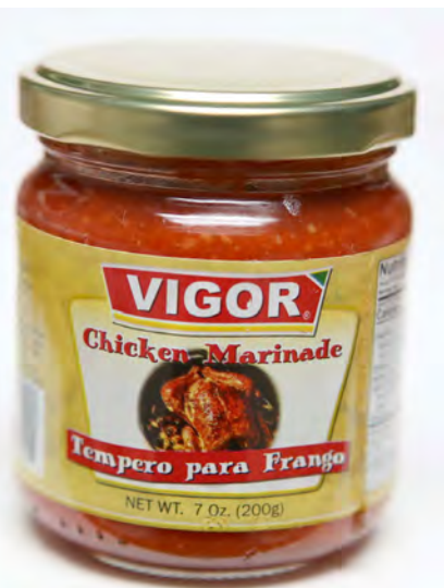
Tempero para Frango

Saudamos todos aqueles que mantêm viva a devoção ao Senhor Santo Cristo dos Milagres!