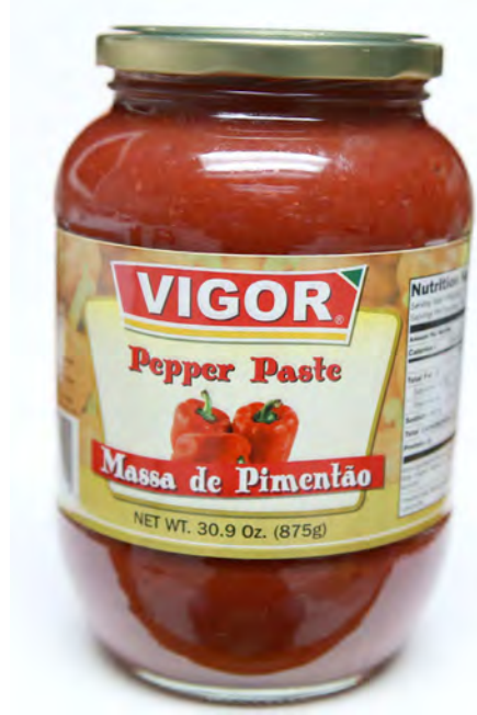
Massa de Pimentão (grande)

Saudamos todos aqueles que mantêm viva a devoção ao Senhor Santo Cristo dos Milagres!