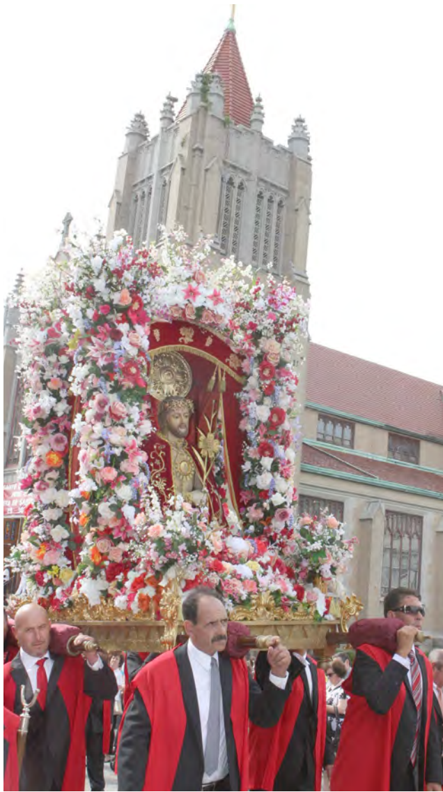
Na foto acima, as festas do Senhor Santo Cristo dos Milagres promovidas pela igreja do mesmo nome na Columbia Street, em Fall River.