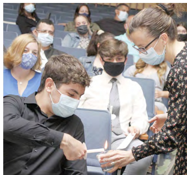
Nas fotos acima e abaixo, alunos do Seekonk High School com círios simbolizando a chama da portugalidade.

“Se lá no assento eterno onde subiu, memórias desta vida se consentem”, Camões deve estar orgulhoso ao ver que a língua portuguesa é ensinada em terras de outras gentes e onde se encontra espaço para uma integração cultural e profissional.