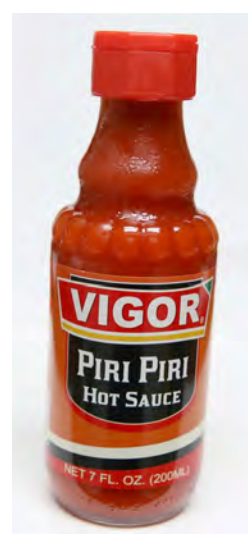
Tempero Piri Piri