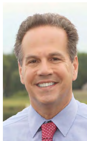
Congressista de RI, David Cicilline.

Texas ganhou dois lugares no Congresso. Flórida, Colorado, North Carolina e Oregon todos ganharam um. Curiosamente, era esperado um aumento de três lugares para o Texas e dois para a Flórida.