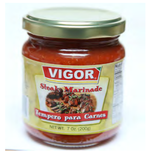
Tempero para Carne