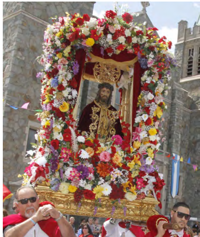
Senhor Santo Cristo na igreja de Nossa Senhora do Rosário em Providence

Street e Canal Street, a 4 de Maio de 1889, é adquirido um modesto templo de madeira onde hoje se ergue imponente a igreja do Senhor Santo Cristo.