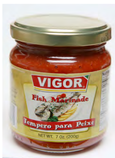
Tempero para Peixe