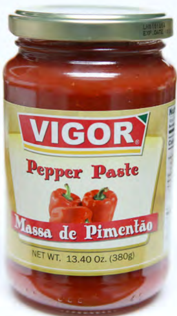
Massa de Pimentão (pequena)